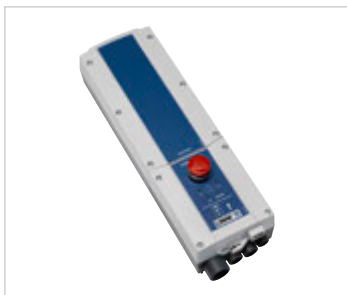
Boîtier de contrôle Linak avec batteries amovibles.