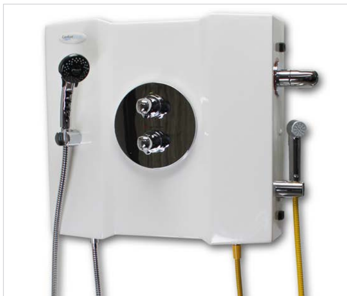
Console de douche murale CPC1000 avec option douchette de désinfection intégrée.