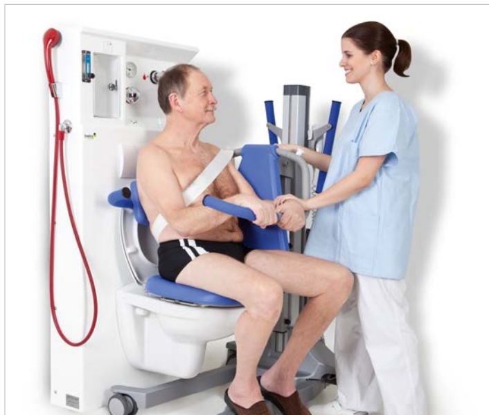
Utilisation facile avec un lève-personne pour les visites à la toilette.