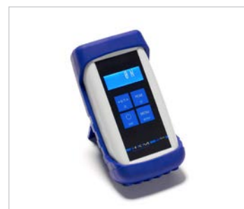
Pèse-personne digital avec affichage du poids du patient.