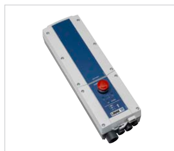
Boîtier de contrôle Linak avec batteries amovibles.